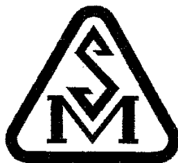
Figura 1. Reprezentarea grafică a mărcii naționale de conformitate SM